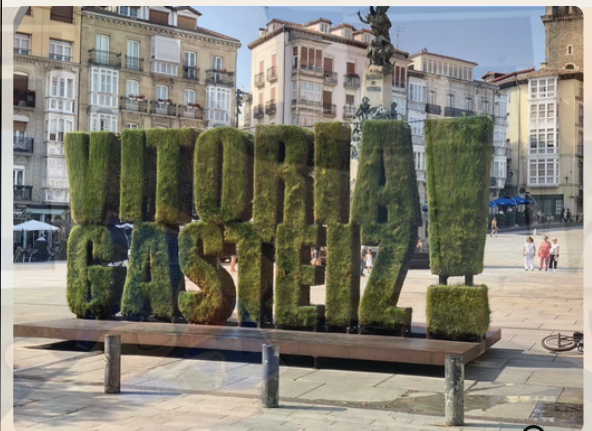
Plaza de la Virgen Blanca