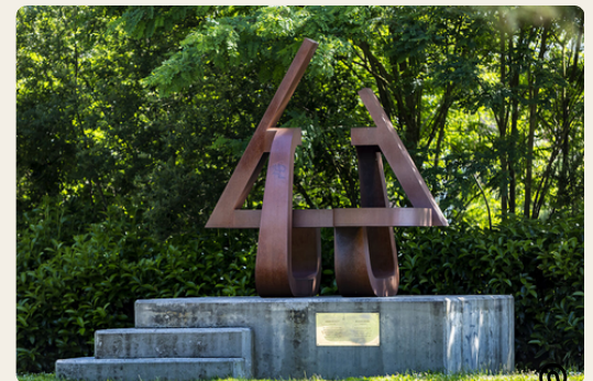
Memoria di una luce