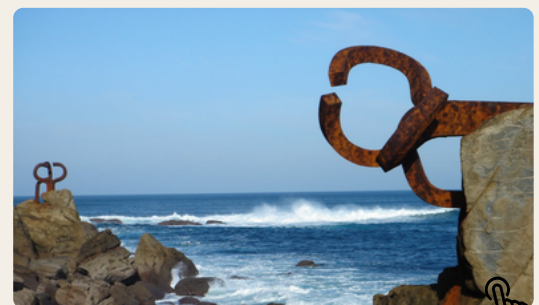
Il pettine del vento, Eduardo Chillida