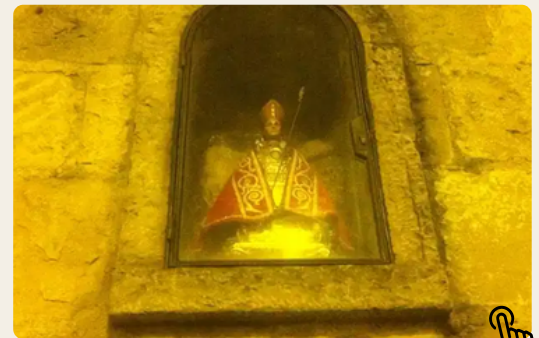
Statua di San Fermín