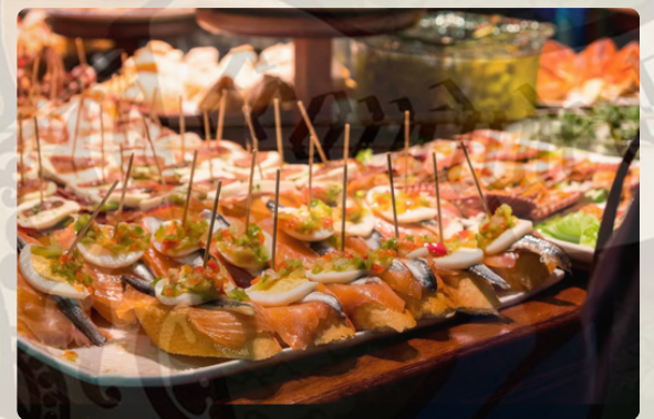
Pintxos: un tesoro della gastronomia basca