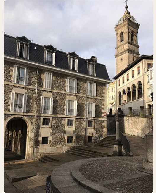
Torre di San Vicente