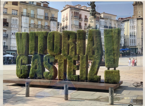
Piazza della Vergine Bianca