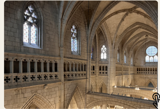
Cattedrale di Santa Maria (Cattedrale Antica). XIII secolo