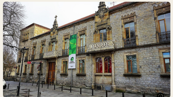
Palazzo Montehermoso. Struttura in stile gotico-rinascimentale del XVI secolo (1524).