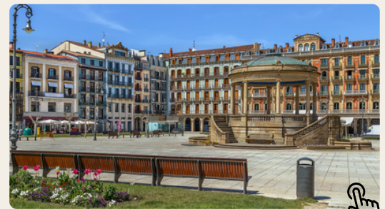
Piazza del Castello