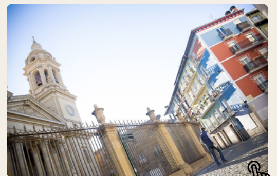
Un percorso attraverso la Pamplona di Hemingway.