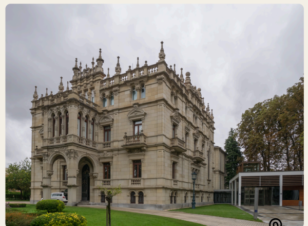
Museo delle Belle Arti di Álava