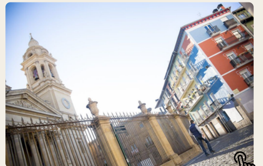
Un parcours à travers Pampelune, la ville d'Hemingway.