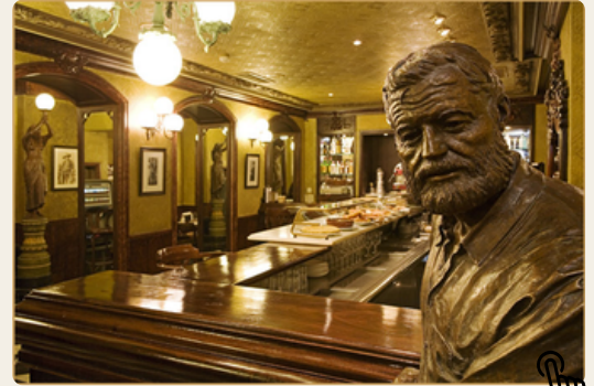
Statue d'Hemingway au Café Iruña.

Je retourne à Vitoria-Gasteiz à 18h30 en bus régulier.