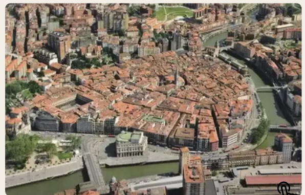
7 rues, Bilbao