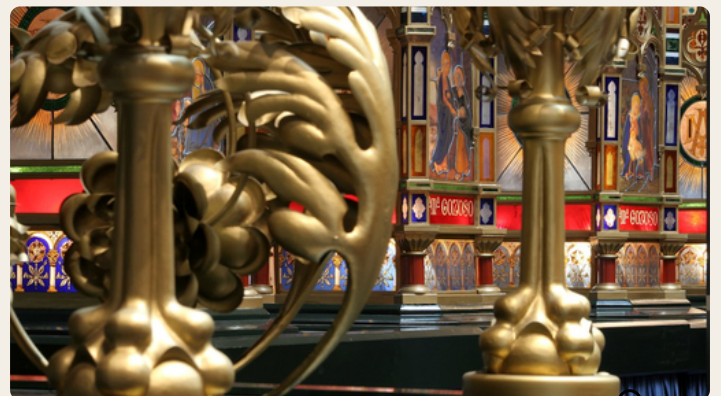
Musée de la Lanterne