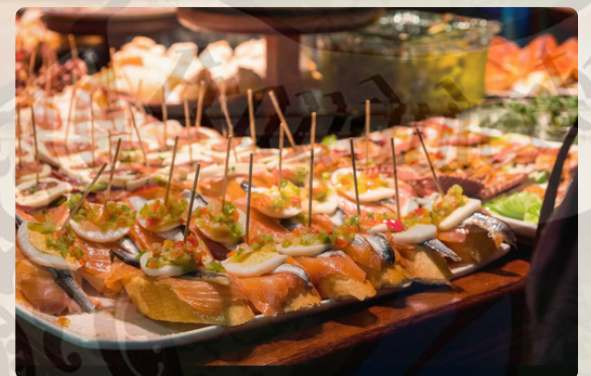
Pintxos : un legs de la gastronomie basque