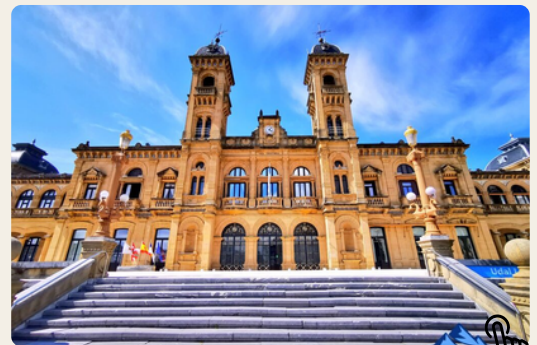
Vue de l'Hôtel de Ville, Saint-Sébastien