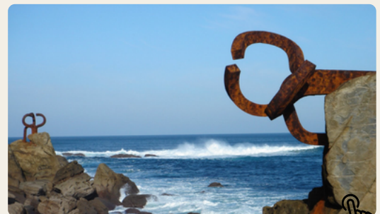
Le Peigne du Vent, Eduardo Chillida