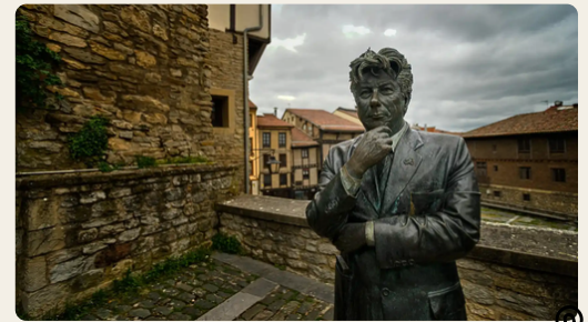
Statue de Ken Follett. XXI e siècle (2008)